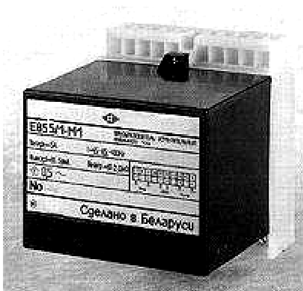
Рисунок 1 – Фотография общего вида

Фотография общего вида ИП приведена на рисунке 1, схема пломбировки от несанкционированного доступа и указание мест для нанесения оттиска клейма ОТК и оттиска клейма знака поверки средств измерений на ИП приведены на рисунке 2.