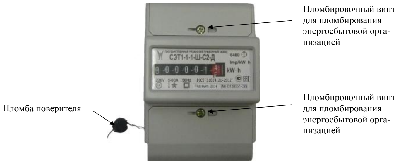
Рисунок 2 Фотография внешнего вида счетчиков СЭТ1 в корпусе для установки на DIN-рейку («Д»).