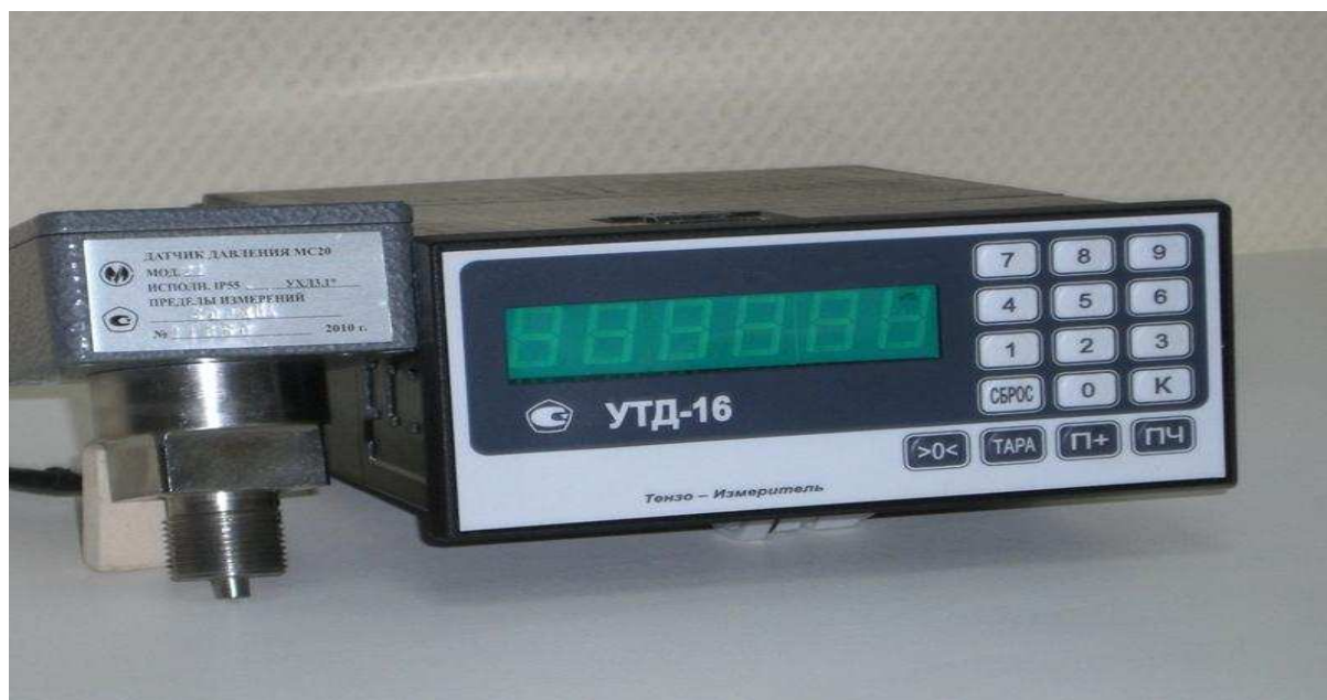
Рис. 1 Общий вид УТД-16

Принцип действия устройства тензометрического для измерения давления жидкости и газа УТД-16 основан на непрерывном преобразовании датчиком давления МС-20 измеряемого давления в унифицированный токовый электрический сигнал 4 - 20 мА и дальнейшем его преобразовании прибором измерительным тензометрическим БУ 4263 в цифровую информацию, которая выводится на табло прибора в единицах измерения давления. Устройство тензометрическое для измерения давления жидкости и газа УТД-16 имеет следующие модификации УТД-16-0,6, УТД-16-1,0, УТД-16-1,6, УТД-16-2,5, УТД-16-4,0, УТД-16-10,0, УТД-16-16,0, УТД-16-25,0, УТД-16-40,0, УТД-16-60,0, УТД-16-100,0, УТД-16-250,0, которые отличаются верхним пределом измерения датчика давления МС-20.