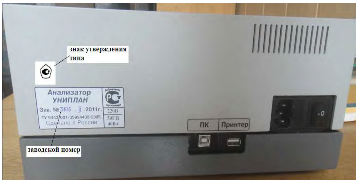
Рисунок 2 – Схема маркировки

Доступ к метрологической части анализатора ограничен. Нижняя панель анализатора зафиксирована винтами, залитыми пломбирующей массой.