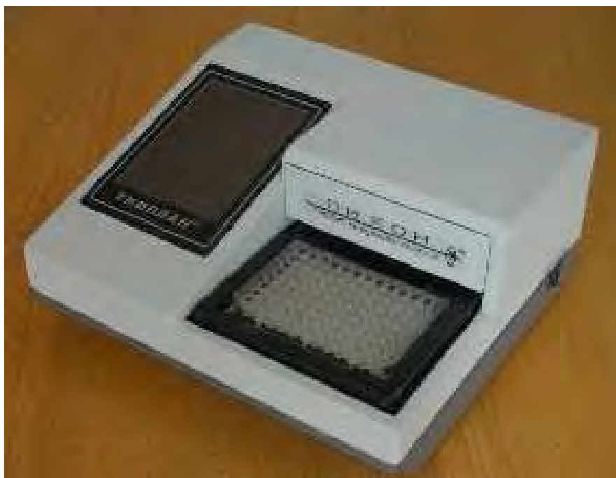
Рисунок 1 – Общий вид анализатора

Оптико-механический блок представляет собой механизм, обеспечивающий взаимно-перпендикулярное перемещение планшета и измерительной головки. Измерительная головка состоит из узла излучения и приемного устройства, между которыми происходит перемещение планшета с измеряемой жидкостью.