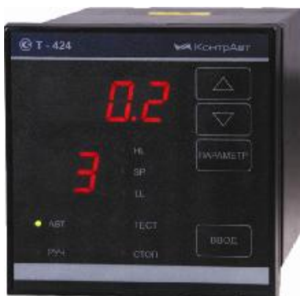
Рисунок 1 – Внешний вид приборов Т-424

Внешний вид приборов Т-424 с конструктивным исполнением в пластмассовом корпусе для щитового монтажа 1/8 DIN (96 × 96) мм приведен на рисунке 1.