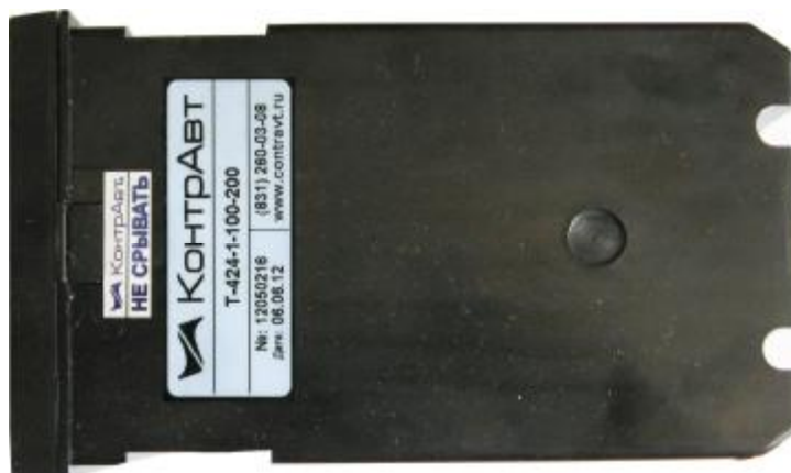
Рисунок 2 – Защита приборов Т-424 от несанкционированного вскрытия с помощью одноразовых гарантийных наклеек контроля вскрытия

Для защиты от несанкционированного доступа, после сборки приборов, на их корпусах наклеиваются одноразовые гарантийные наклейки контроля вскрытия, которые самоуничтожаются при несанкционированном вскрытии. Внешний вид приборов с гарантийными одноразовыми наклейками контроля вскрытия приведены на рисунке 2.