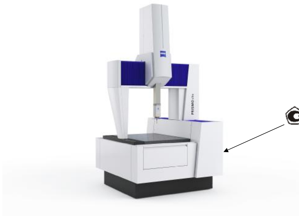
Рисунок 2 - Внешний вид координатных измерительных машин PRISMO ULTRA и место нанесения знака утверждения типа