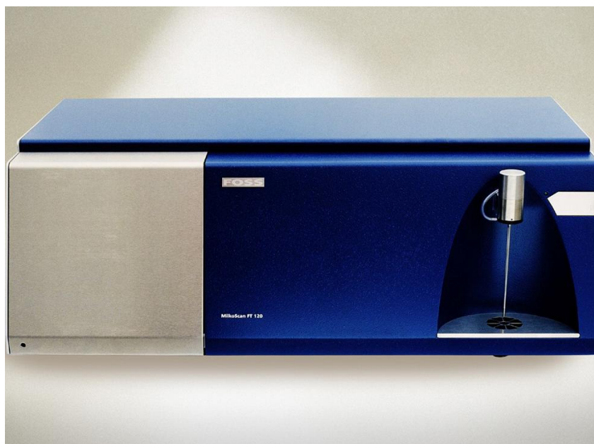
Рис. 1 Внешний вид анализаторов MilkoScan FT 120

Внешний вид анализаторов приведен на рисунках 1, 2 и 3