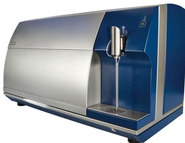
Рис. 3 Внешний вид анализаторов MilkoScan FT2