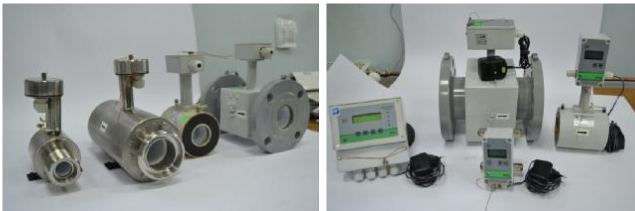
Рисунок 1 – Общий вид расходомеров-счетчиков электромагнитных РСЦ

Общий вид расходомеров-счетчиков электромагнитных РСЦ приведен на рисунке 1.