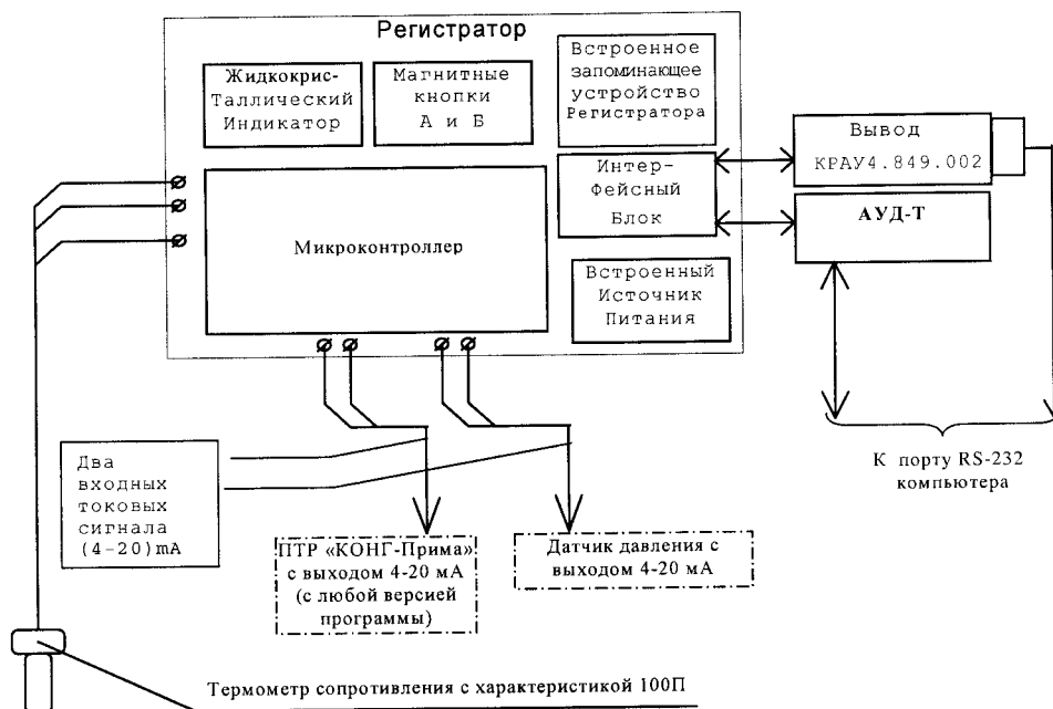
Рис.1. Структурная схема регистратора

Состав регистратора и схема взаимодействия его с датчиками показаны на рис.1.