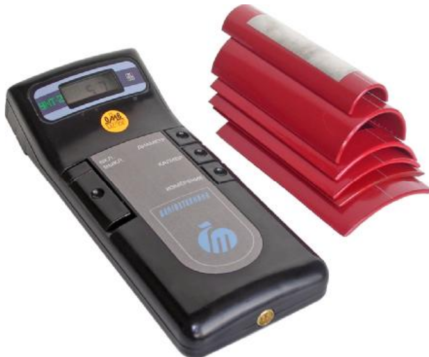
Рисунок 1 Внешний вид устройства контроля толщины изоляции УКТ-2

Внутри корпуса установлена плата и преобразователь. Последний закреплен в верхней части корпуса. В месте расположения преобразователя снаружи на боковых стенках корпуса имеются две плавающие опоры для ориентации устройства при измерении.