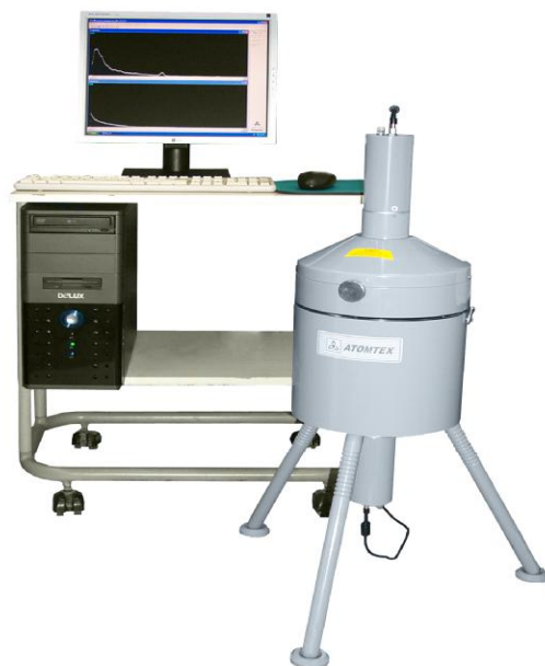
Рисунок 1 - Общий вид спектрометра

Общий вид спектрометра представлен на рисунке 1.