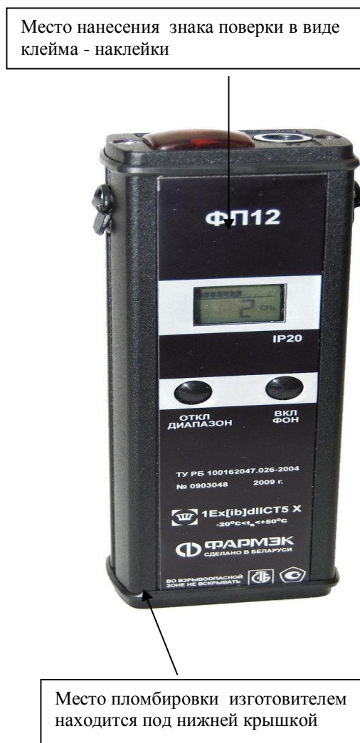
Рисунок 2- Схема пломбировки для защиты от несанкционированного доступа и обозначение мест для нанесения оттисков клейм

Стрелками указаны места пломбировки от несанкционированного доступа и обозначение мест для нанесения оттисков клейм.