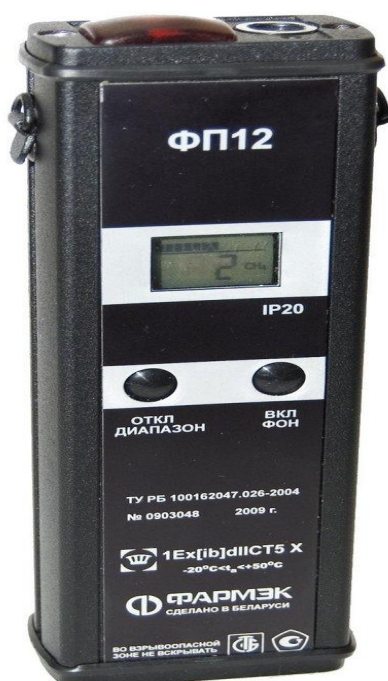
Рисунок 1- Внешний вид течеискателя-сигнализатора ФП 12

Внешний вид течеискателя-сигнализатора ФП 12 приведен на рисунке 1.