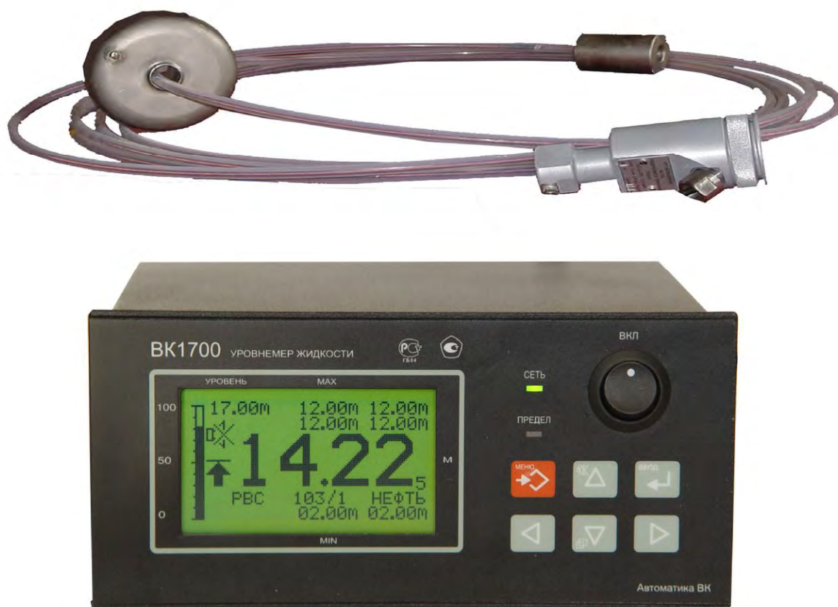
Рисунок 1- Общий вид уровнемера BK1700

Общий вид уровнемера приведен на рисунке 1.