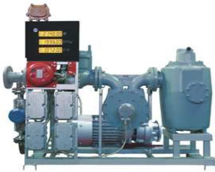
Рисунок 1.1 - Общий вид установки измерительной модель «Нара-210»

Общий вид установки показан на рисунках 1.1-1.2.