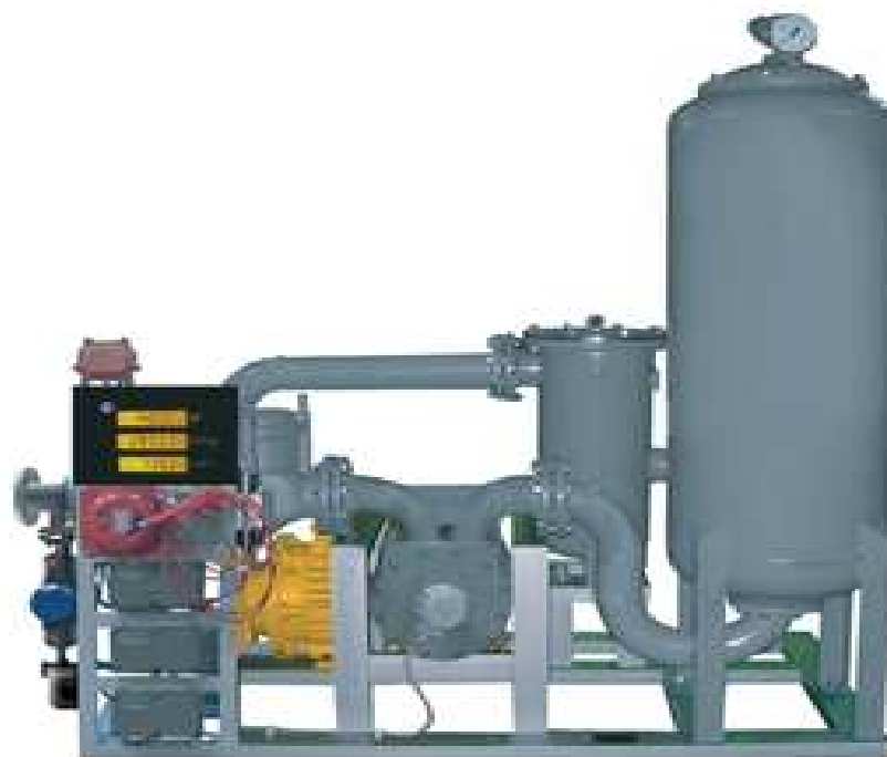
Рисунок 1.2 - Общий вид установок измерительных моделей «Нара-220» и «Нара-230»

В установках предусмотрено опломбирование измерителя объема поршневого, микропроцессора электронного отсчетного устройства и указателя суммарного учета.