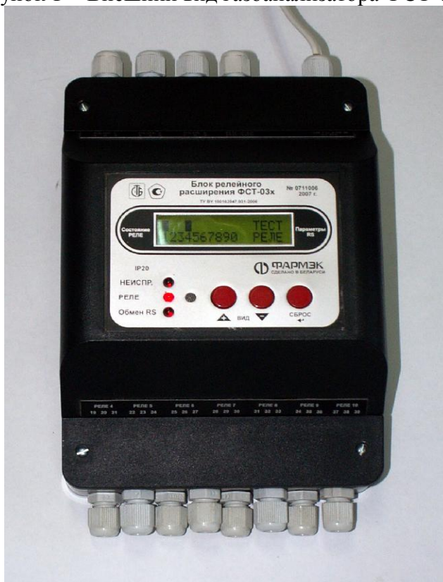
Рисунок 2 - Внешний вид БРР