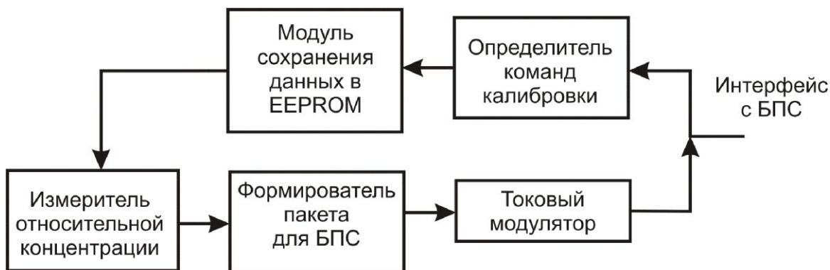
Рисунок 4- Структура ПО блока датчика.

Основные функции встроенного ПО БД следующие: