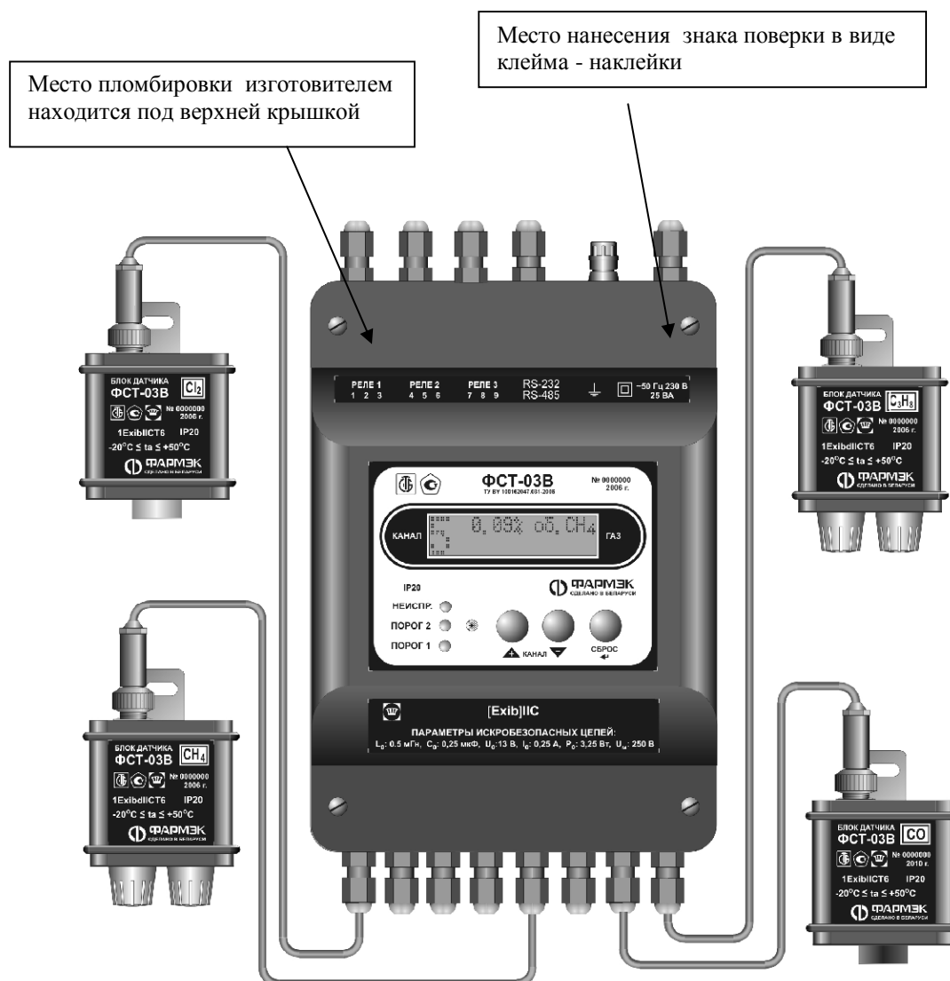
Рисунок 3- Схема пломбировки для защиты от несанкционированного доступа и обозначение мест для нанесения оттисков клейм

Стрелками указаны места пломбировки от несанкционированного доступа и обозначение мест для нанесения оттисков клейм.