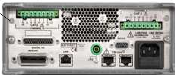
Фотография 2. Задняя панель

Пломбирование от несанкционированного доступа производится нанесением на заводе-изготовителе или в авторизованном сервисном центре специальной краски под левый верхний винт на задней панели. Знак поверки в виде наклейки размещается в середине боковой панели.