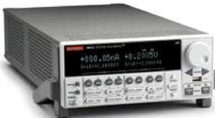
Фотография 1. Общий вид

Внешний вид приборов показан на фотографии 1, задняя панель – на фотографии 2.