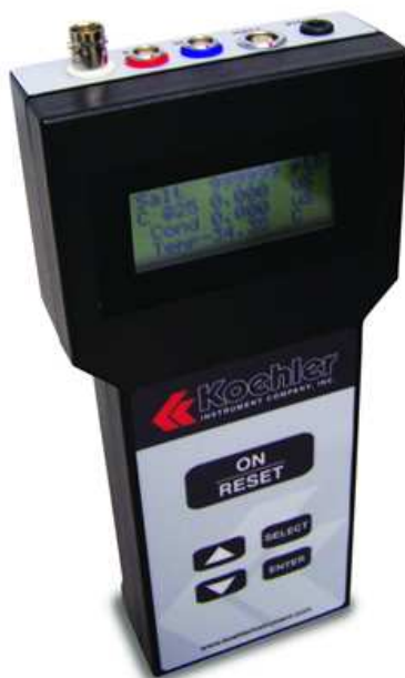
Рисунок 1 – Внешний вид анализатора содержания солей в нефти кондуктометрического K23050

Внешний вид анализатора приведен на рисунке 1.