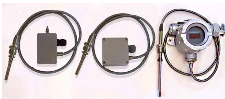
Погружаемые общепромышленные ППТ моделей ППТСК (с соединительным кабелем), в том числе с ЦД