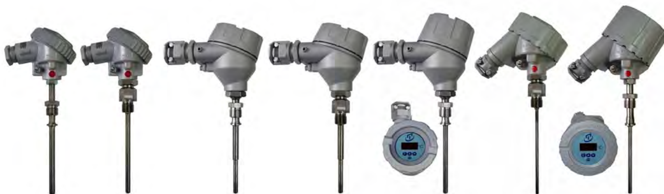
Погружаемые общепромышленные ППТ моделей ППТС/С (в том числе с ЦД), ППТС/В, ППТС/ОВ