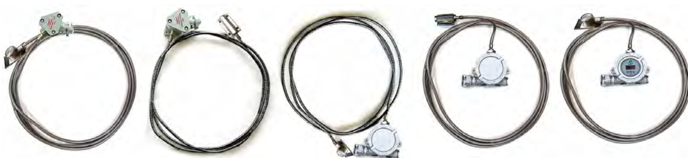
Поверхностные ППТ моделей ППТП для измерения температуры поверхности наземных и подземных трубопроводов с видами взрывозащиты «Взрывонепроницаемая оболочка» по ГОСТ Р 52350.1-2005 и «Искробезопасная электрическая цепь «i» по ГОСТ Р 52350.11-2005