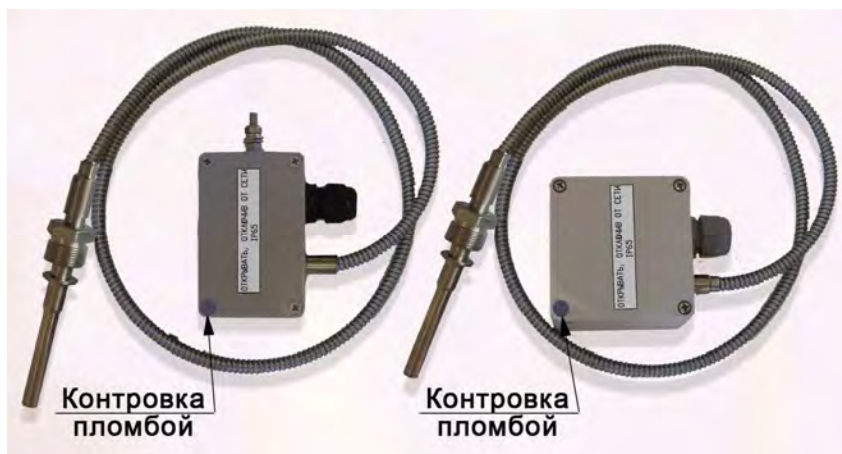
Погружаемые ППТ моделей ППТСК (с соединительным кабелем) с видом взрывозащиты «Искробезопасная электрическая цепь «i» по ГОСТ Р 52350.11-2005