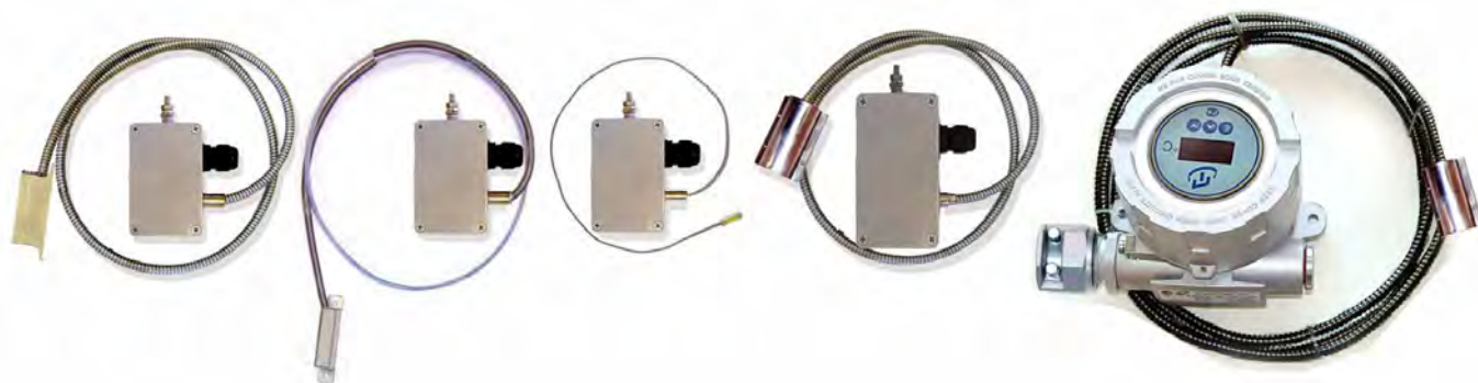
Поверхностные общепромышленные ППТ моделей ППТП (с соединительным кабелем), в том числе с ЦД