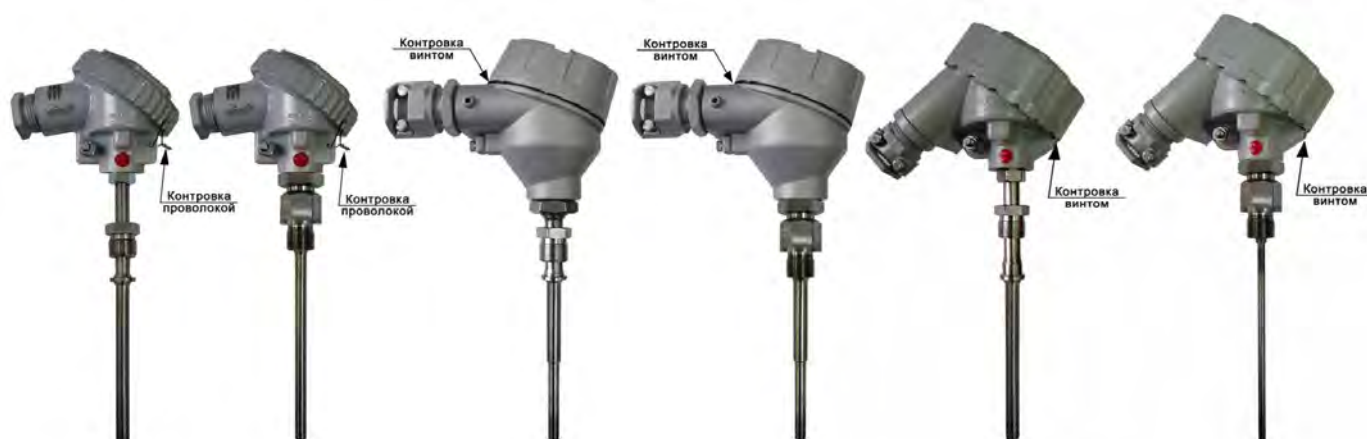
Погружаемые ППТ моделей ППТС/С, ППТС/В, ППТС/ОВ с видом взрывозащиты «Искробезопасная электрическая цепь «i» по ГОСТ Р 52350.11-2005