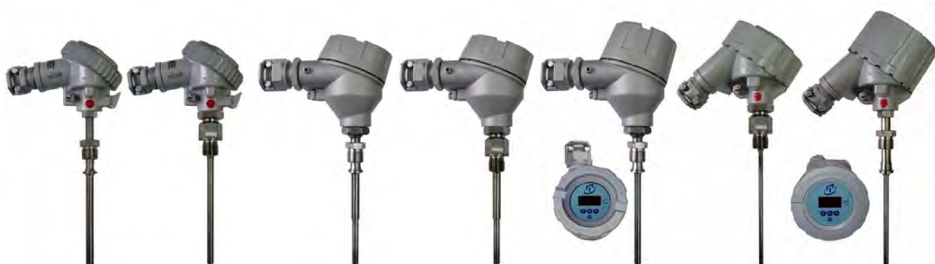
Погружаемые ППТ моделей ППТС/С (в том числе с ЦД), ППТС/В, ППТС/ОВ с видом взрывозащиты «Взрывонепроницаемая оболочка» по ГОСТ Р 52350.1-2005