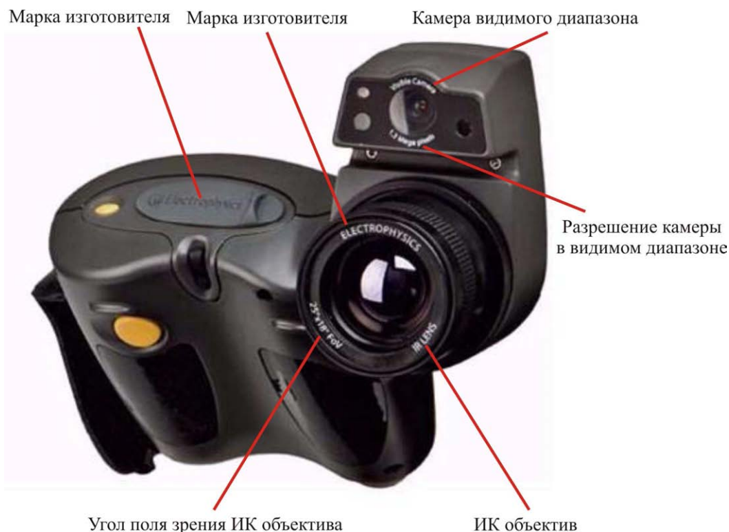
Рисунок 1 - Схема маркировки передней панели камеры инфракрасной

Вид сзади камеры инфракрасной с указанием схемы пломбирования, наименования прибора и места расположения этикетки с указаниями по работе с лазером представлен на рисунке 2.