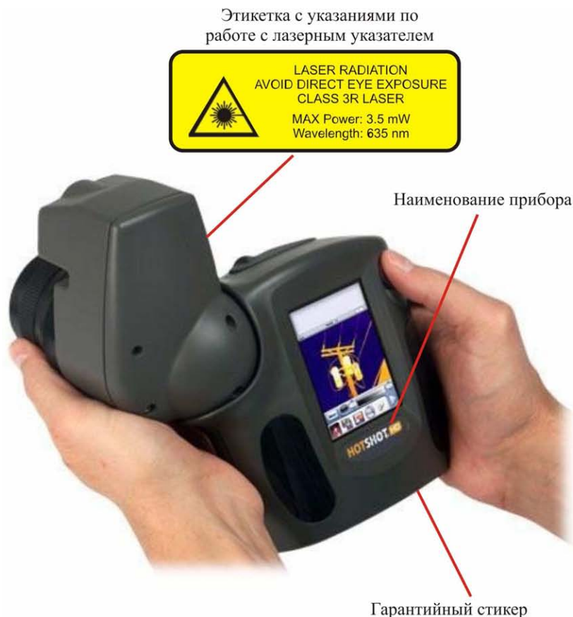
Рисунок 2 - Схема пломбирования и маркировки задней панели камеры инфракрасной

Вид сзади камеры инфракрасной с указанием схемы пломбирования, наименования прибора и места расположения этикетки с указаниями по работе с лазером представлен на рисунке 2.