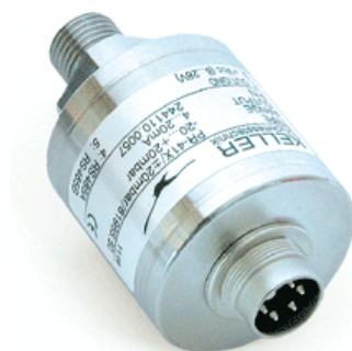
Рисунок 1 – Преобразователь давления измерительный PR-41

Внешний вид преобразователя приведен на рисунке 1.