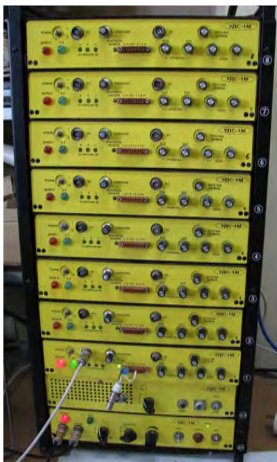
Рисунок 1 – Внешний вид дефектоскопа ультразвукового восьмиканального УДС-1М