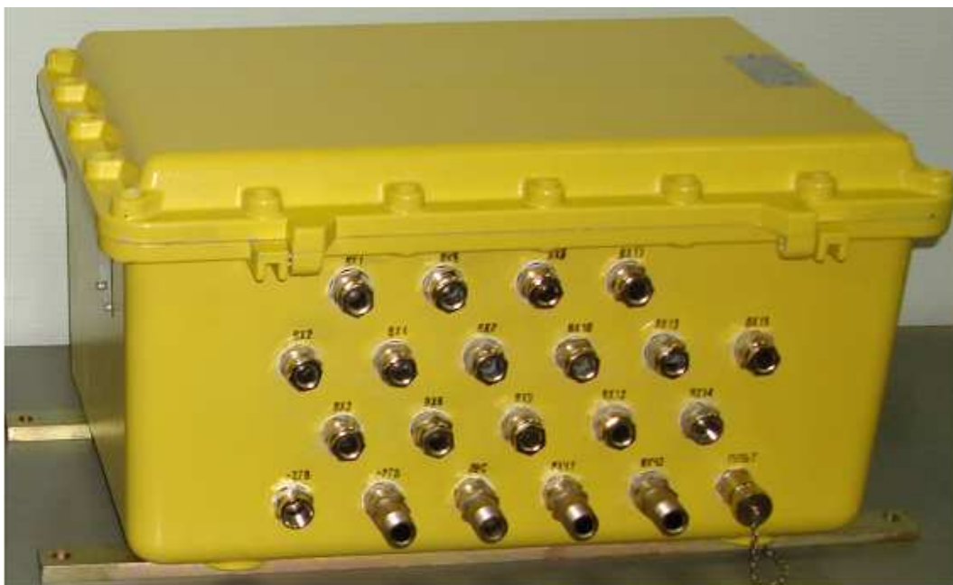
Рисунок 1 Внешний вид БОС