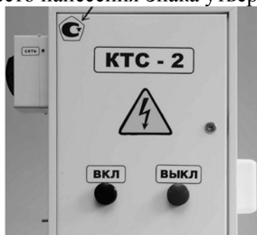
Блок управления КТС-2