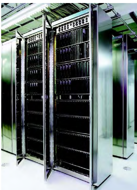
Рисунок 1 Общий вид оборудования с открытой дверью

Общий вид оборудования и схема пломбировки от несанкционированного доступа, представлены на рисунках 1 и 2.