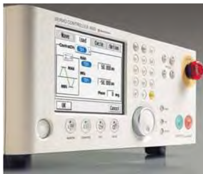
Рис. 2. Общий вид электронного блока управления 4830