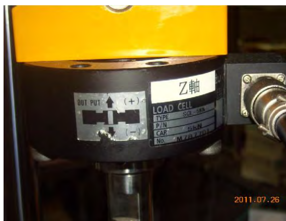
Рис. 3. Общий вид тензорезисторного датчика типа SCL