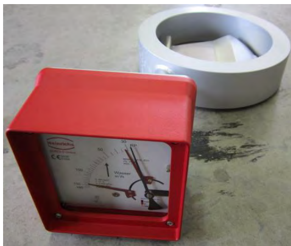
Фото 1 - Внешний вид расходомера

Внешний вид и конструкция расходомеров представлены на фото 1 и рисунке 1.