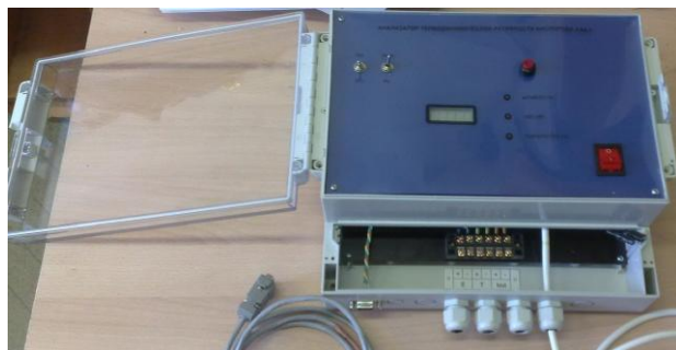
Рисунок 1 – Общий вид анализатора ААК-1