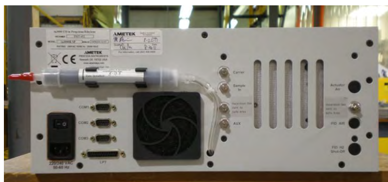
Внешний вид анализатора ta3000R