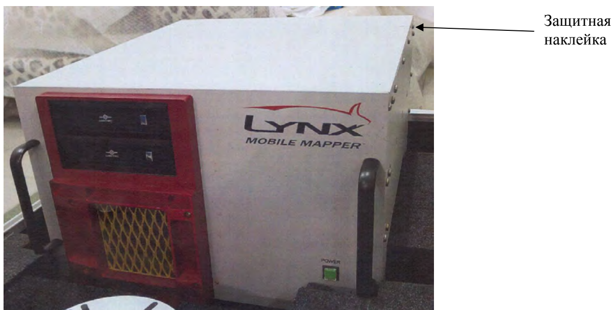
Рисунок 4 – схема размещения наклейки на блоке управления