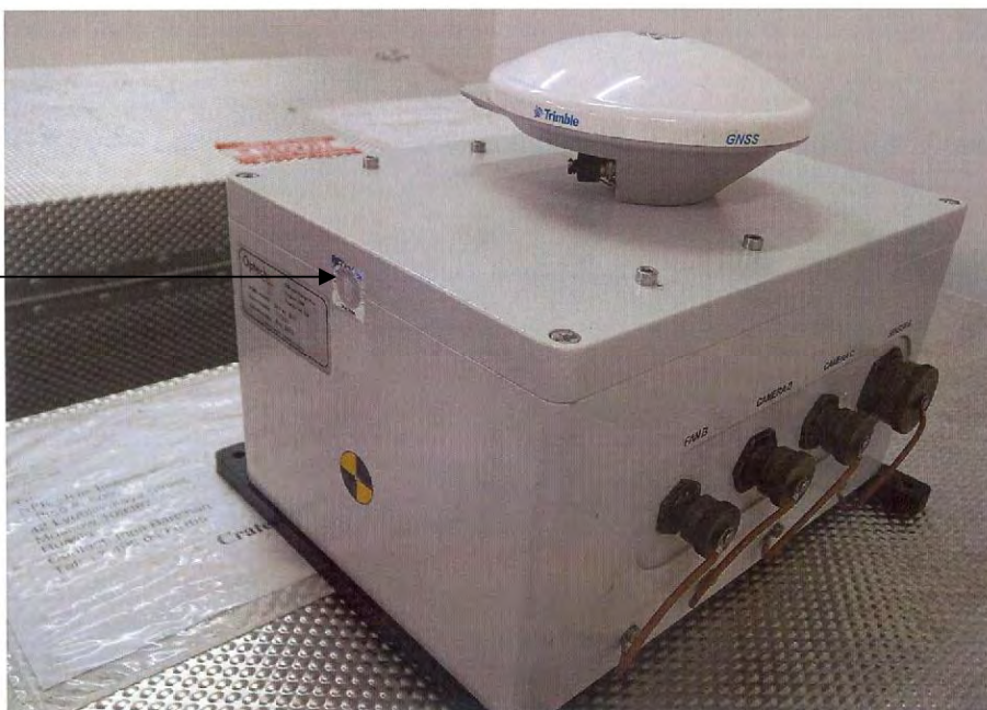
Рисунок 3 – схема размещения наклейки на антенном блоке с приемником GPS