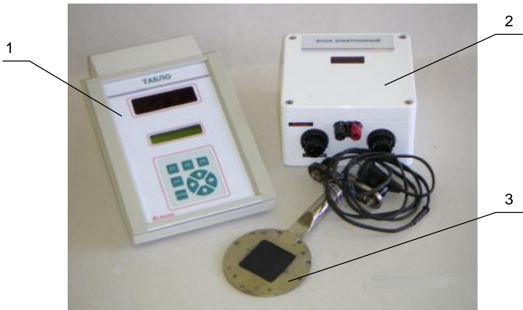
1 – табло; 2 – блок электронный; 3 – преобразователь балансомера;

Внешний вид балансомера представлен на рисунке 1.