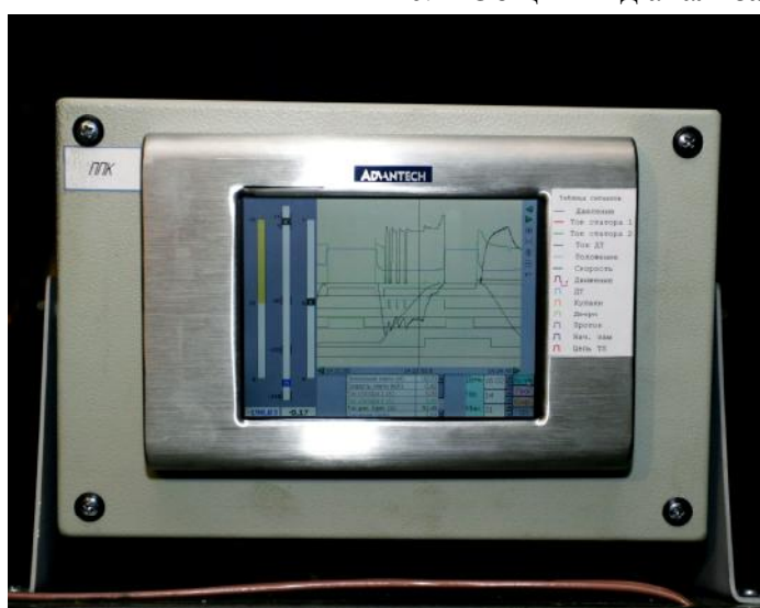
Рис. 3 Общий вид панельного компьютера РПУ-03.1, РПУ-03.5