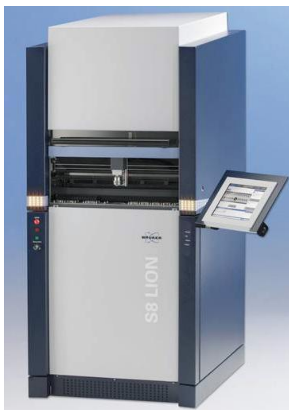
Рисунок 1 - Общий вид спектрометра рентгенофлуоресцентного S8 LION.

Спектрометры рентгенофлуоресцентные S8 LION представляют собой стационарные многоцелевые, автоматизированные приборы, обеспечивающие измерение, обработку и регистрацию выходной информации.