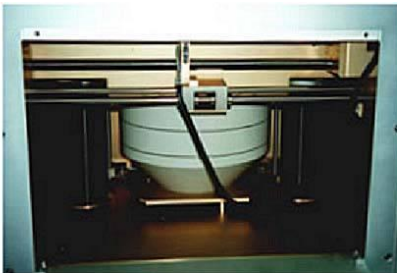
Рисунок 1 – Общий вид FMD-01М.

FMD-01М использует ручное устройство смены пробоотборников («движок»), приспособленное для размещения круглых фильтров диаметром до 60 мм (диаметр активного пятна до 50 мм) и толщиной до 1 мм, а также квадратных проб грязных пятен, 50 x 50 мм, толщиной до 5 мм. Стандартная конфигурация оборудования позволяет проводить измерения с коррекцией фона.