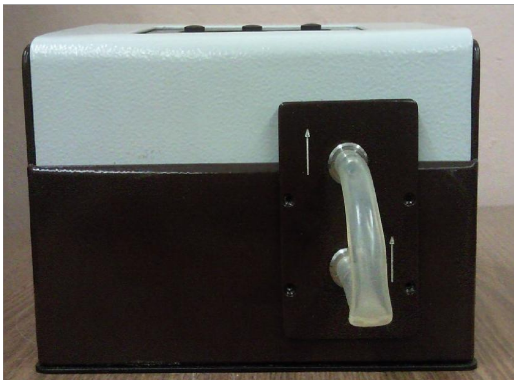
Рисунок 3 – Измерительный блока газоанализатора «ТЕСТ-902-2М», вид боковой панели.