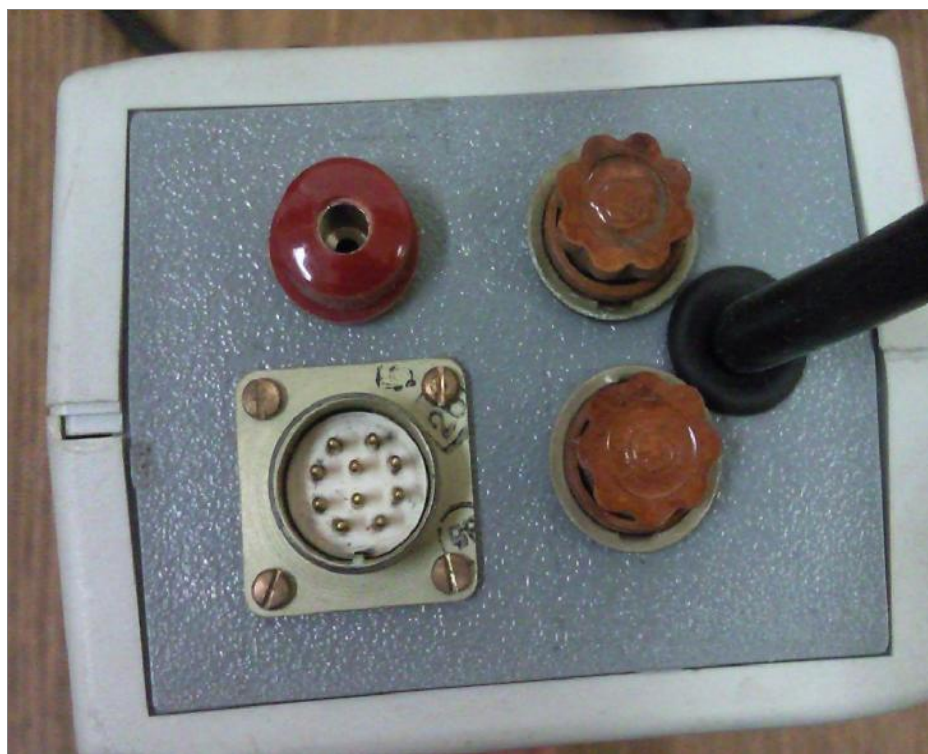
Рисунок 5 – Блок питания газоанализатора «ТЕСТ-902-2М», вид задней панели.