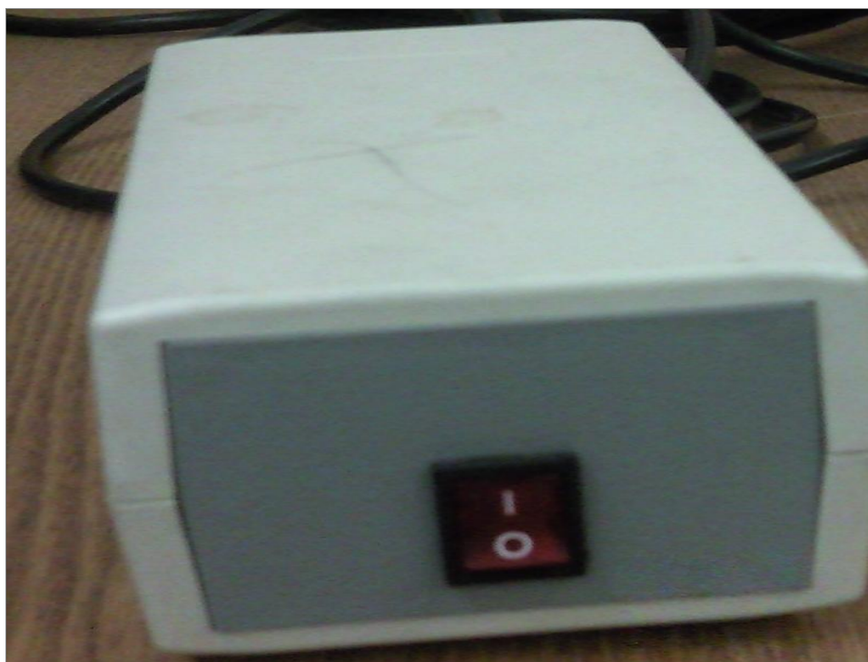
Рисунок 4 – Блок питания газоанализатора «ТЕСТ-902-2М», внешний вид.