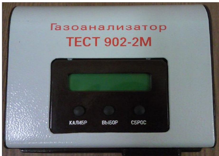
Рисунок 1 – Измерительный блока газоанализатора «ТЕСТ-902-2М», внешний вид.