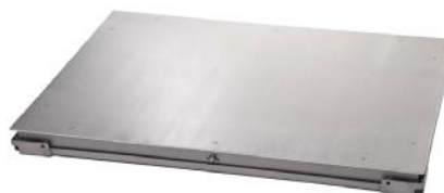
Рисунок 1 - Внешний вид ГПУ