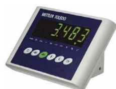
IND221 / IND226