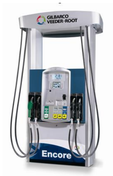
Рисунок 1. Колонка топливораздаточная Encore 500S