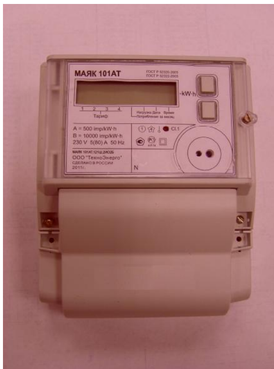
Рисунок 1 – Внешний вид счетчика с закрытой клеммной крышкой

Внешний вид счетчика МАЯК 101АТ с закрытой клеммной крышкой приведён на рисунке 1.