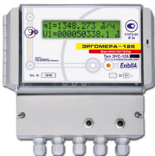
Фотография общего вида