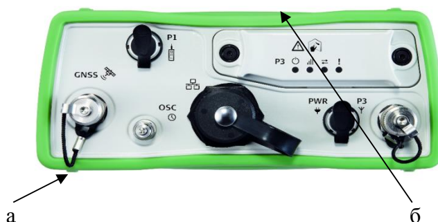
Рисунок 2 – Вид приемника со стороны задней панели