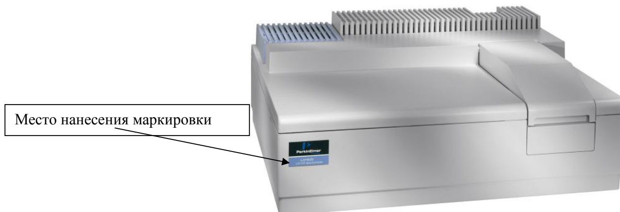
Рисунок 1 - Общий вид Спектрофотометров Lambda 25, Lambda 35, Lambda 45 и место нанесения маркировки.

В качестве выходного интерфейса используется RS 232C.