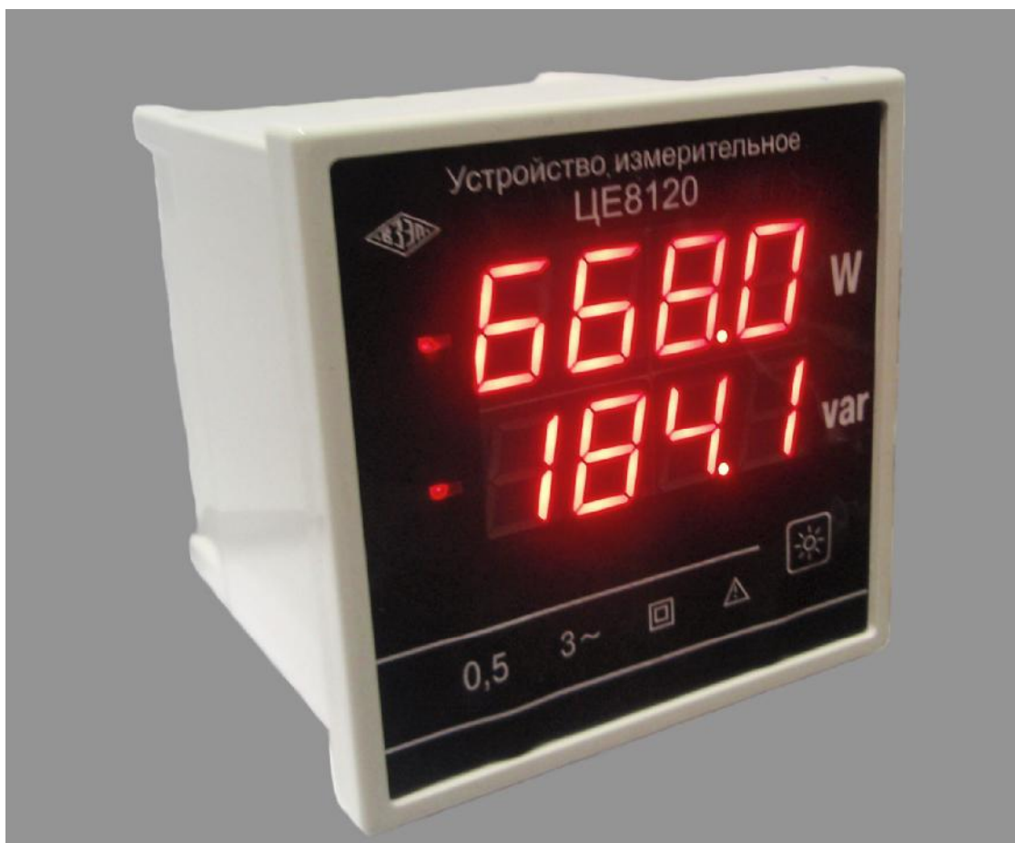
Рисунок 1 – Внешний вид устройства измерительного CE8120