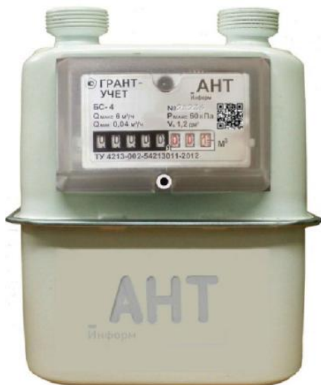
Фото 1. Общий вид счетчика газа бытового ГРАНТ-УЧЕТ БС-4