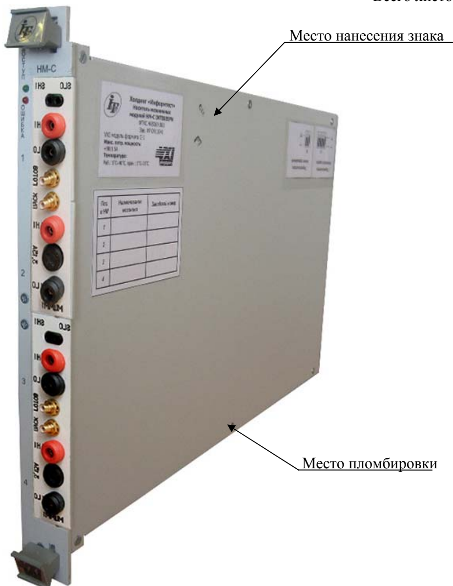
Рисунок 3 – Внешний вид носителя мезонинных модулей типа НМ (НМ-С, НМУ) с установленными мультиметром цифровым, указанием места нанесения знака утверждения типа и местом пломбировки