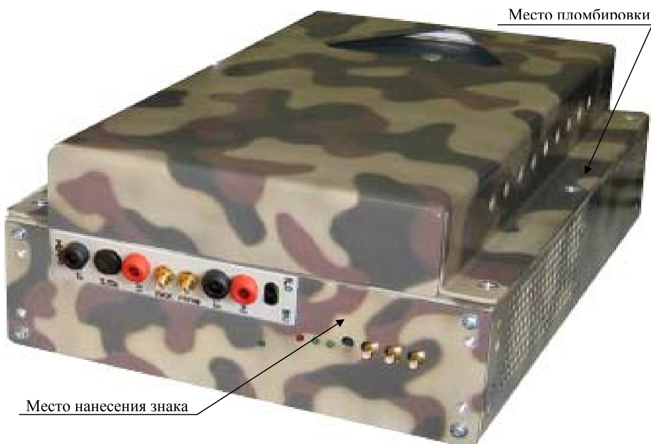
Рисунок 2 – Внешний вид устройства MezaBox\Battery 133W-hrs с установленным мультиметром цифровым, указанием места нанесения знака утверждения типа и местом пломбировки