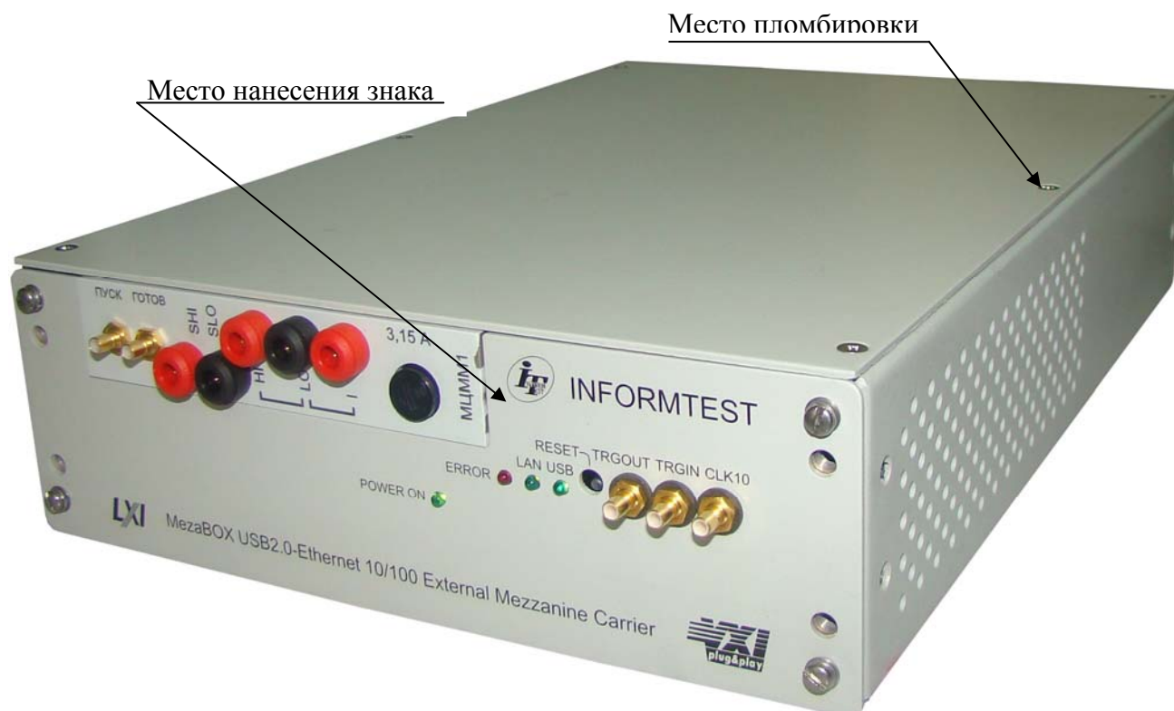
Рисунок 1 – Внешний вид устройства MezaBox с установленным мультиметром цифровым, указанием места нанесения знака утверждения типа и местом пломбировки