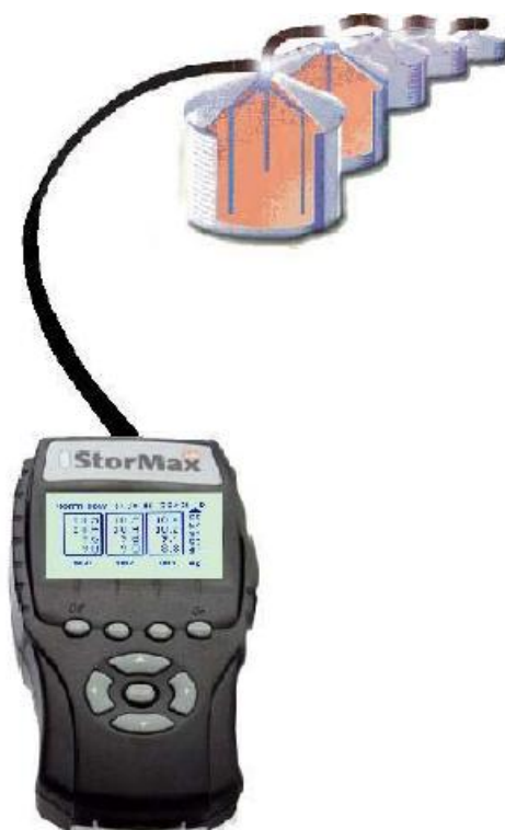
Рис.3 - Схематичное изображение системы StorMax.