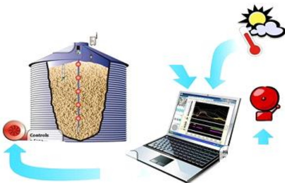
Рис.2 - Схематичное изображение системы IntegrisPro.