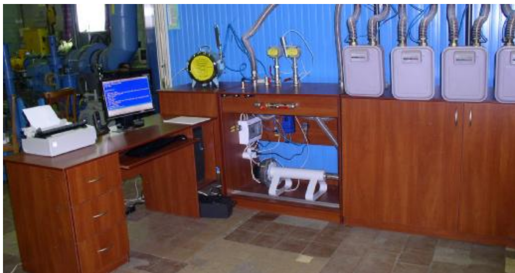
Фото 1. Общий вид установки компьютеризированной для определения и контроля метрологических характеристик бытовых счетчиков газа «Темпо-3».

На фото 1 приведен общий вид установки компьютеризированной для определения и контроля метрологических характеристик бытовых счетчиков газа «Темпо-3».