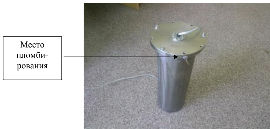
Рисунок 4 – Схема места пломбирования спектрометра