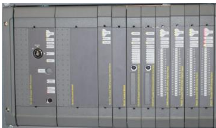
Общий вид контроллера с модулями ввода/вывода