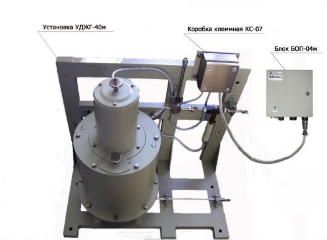
Рис. 1. Внешний вид установки радиометрической УДЖГ-42Р-06.