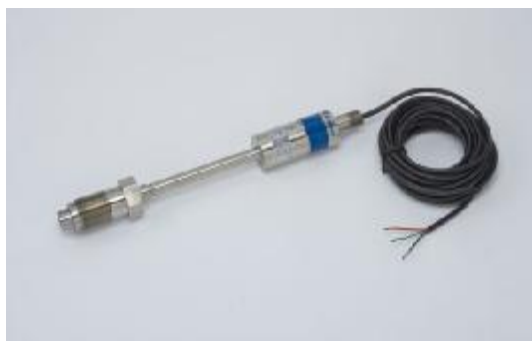
Рисунок 7 – Общий вид преобразователей моделей SPX-L (5341 - 5392), SPX-T (3241 - 3392)