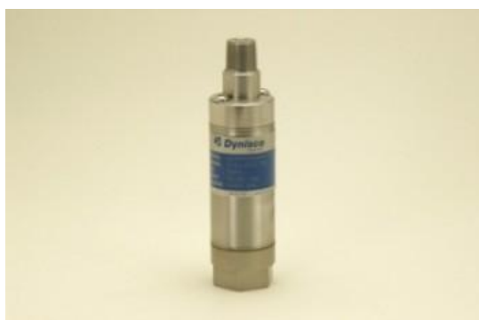
Рисунок 5 – Общий вид преобразователей модели SPX (2000 - 2999)