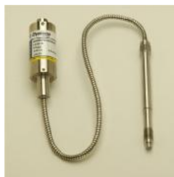
Рисунок 6 – Общий вид преобразователей модели SPX (4000 - 4999)