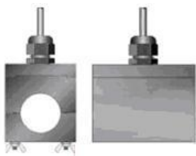
а) DTTS, DTTC

Фотографии внешнего вида расходомеров и места нанесения поверительных клейм (наклеек и пломб)