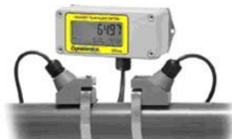
б) разнесенное исполнение