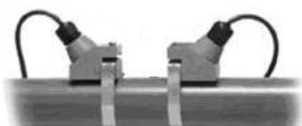
в) DTTN, DTTH, DTTL