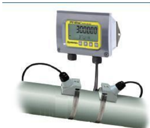
б) разнесенное исполнение