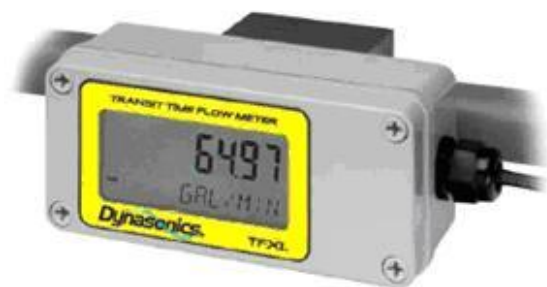
а) компактное исполнение