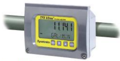
а) компактное исполнение