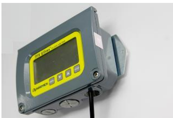
Рисунок 5. Места нанесения поверительных клейм (наклеек и пломб)